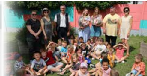
M. le Maire et les membres du conseil municipal sont allés saluer le départ de trois enseignantes avant les vacances.