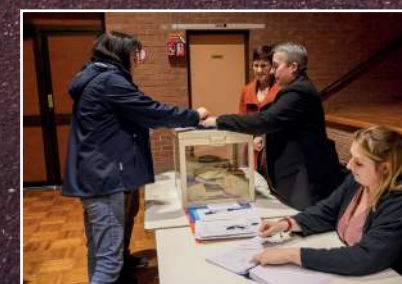
Élections municipales le 15 mars 2026.

Le nouveau conseil municipal est en place !