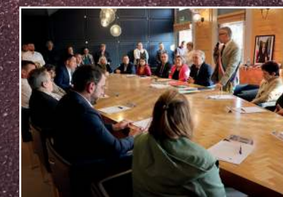
Élections du Maire et des adjoints le 21 mars 2026.