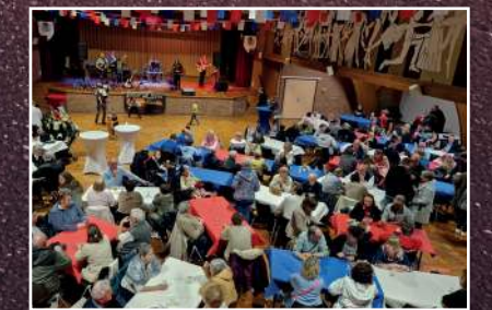
Repas friterie offert par la municipalité.